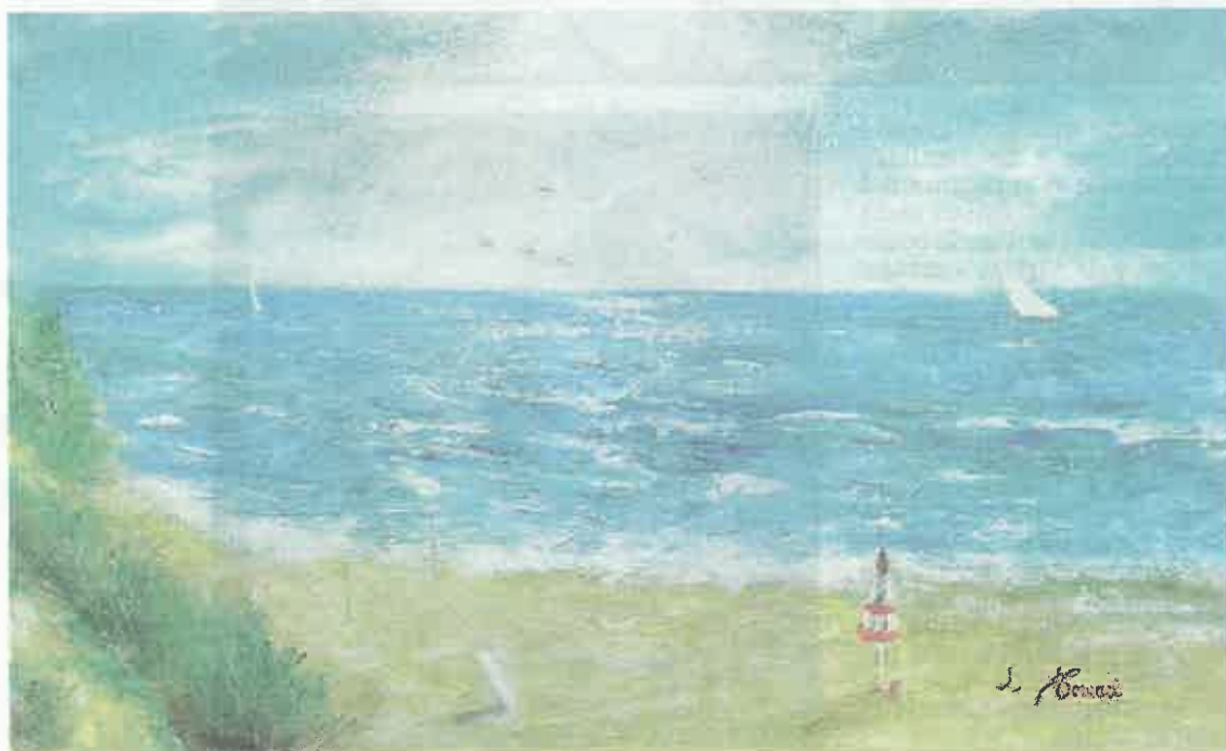
Uno dei bellissimi paesaggi del Maestro Luciano Tomasi (al Museo dell'Abbazia di Valvisciolo)

Tutti i colori della campagna pontina e romana catturati e riproposti dalla vena artistica del Maestro Luciano Tomasi fino a domani potranno essere ammirati presso la Sala Capitolare Museo dell'Abbazia di Valvisciolo. La personale, intitolata "I colori luminosi delle stagioni" propone un vero e proprio viaggio, poetico e suggestivo, tra paesaggi naturali e luminosi che si trasformano lungo il corso dell'anno. Oltre trenta le opere esposte, realizzate dall'artista negli ultimi due anni, dipinti di diverso formato e di tecniche, dall'acquerello, sanguigna, carboncino, seppia di china, incisioni, acqueforti, litografie, olii, tempera. «È possibile scorgere, nelle varie fasi nella sua pittura - leggiamo nelle note di presentazione - rimandi ad un passato, filtrato però da uno sguardo contemporaneo, come può evincersi dal luminoso trionfo della primavera ovvero dall'opera intitolata 'Alba sulla campagna pontina'. Il colore luminoso della luce che s'impone sul freddo oscuro, viene illuminato dall'intensa luce artificiale della nostra epoca». I dipinti ritraggono incantevoli paesaggi e suggestive marine; e così all'improvviso ci si trova davanti alle dune di Sabaudia o su distese di terreni dei poderi della bonifica. Lo studio del colore va di pari passo con l'osservazione della natura, dei suoi cambiamenti, dei fenomeni atmosferici. Tutte immagini che diventano un richiamo allo scorrere del tempo e delle stagioni stesse.