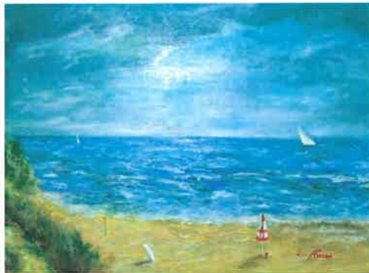
Dopo una giornata al mare olio su tela 30x40 cm.